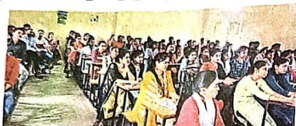
ओजोन दिवस पर आयोजित कार्यक्रम में उपस्थित शिक्षक व छात्र-छात्राएं।