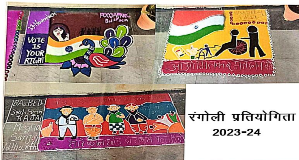
रंगोली प्रतियोगिता 2023-24